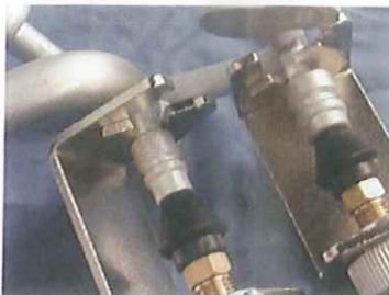
A/C SERVICE PORT